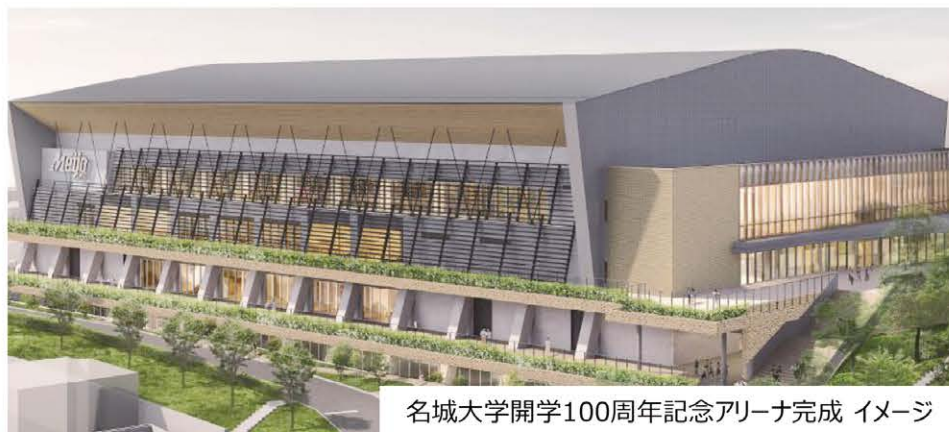
名城大学開学100周年記念アリーナ完成 イメージ

次の100年に向け「中部から世界へ 創造型実学の名城大学」という将来ビジョンを策定いたしました。先見性、多様性、専門性を身につけ、実行力、実現力を備えた世界で活躍できる人材を育成します。