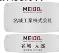
銘板プレートイメージ