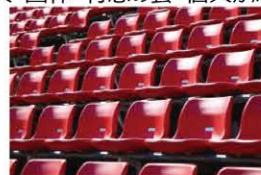
アリーナ内観客席 イメージ

「名城大学開学100周年記念アリーナ椅子銘板募金」を開始いたしました。当企画へお申し込みいただくと、新設されるアリーナの観客席（背板）に寄付者のご芳名を刻ませていただきます。募集数は先着482席で、法人・団体・有志の会・個人が応募いただけます。